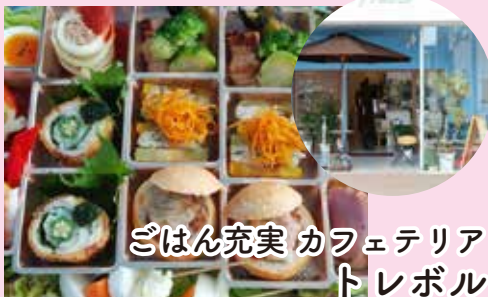
ごはん充実 カフェテリア トレボル

日本発のケーキ屋によるキッチンカーが誕生しました。 あなたの街にグランシャリオとワクワクを届けます。