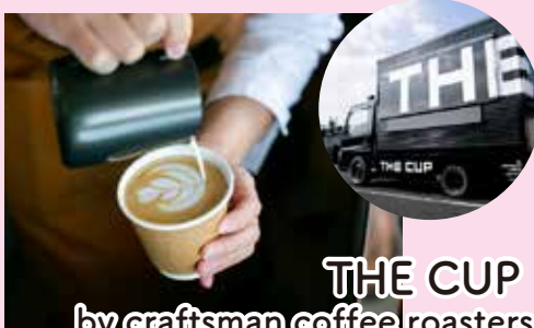
THE CUP by craftsman coffee roasters

黒いトラックのスペシャルティーコーヒー専門店！ あなたの街へ最高の 1 杯をお届けします！