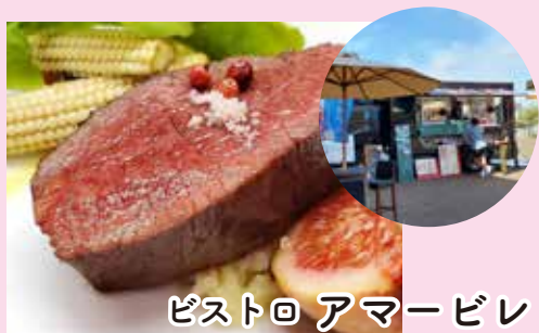
ピストロ アマービレ

走るレストランの異名を持つフードトラック。 絶品ジビエを中心にフレンチや人気のオムライスなど。